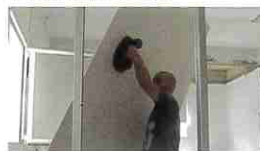
大判建材パネルの運搬に