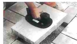
敷石・舗装工事に