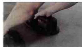
タイルや床材などの施工に