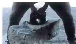
重量物の運搬・移動に